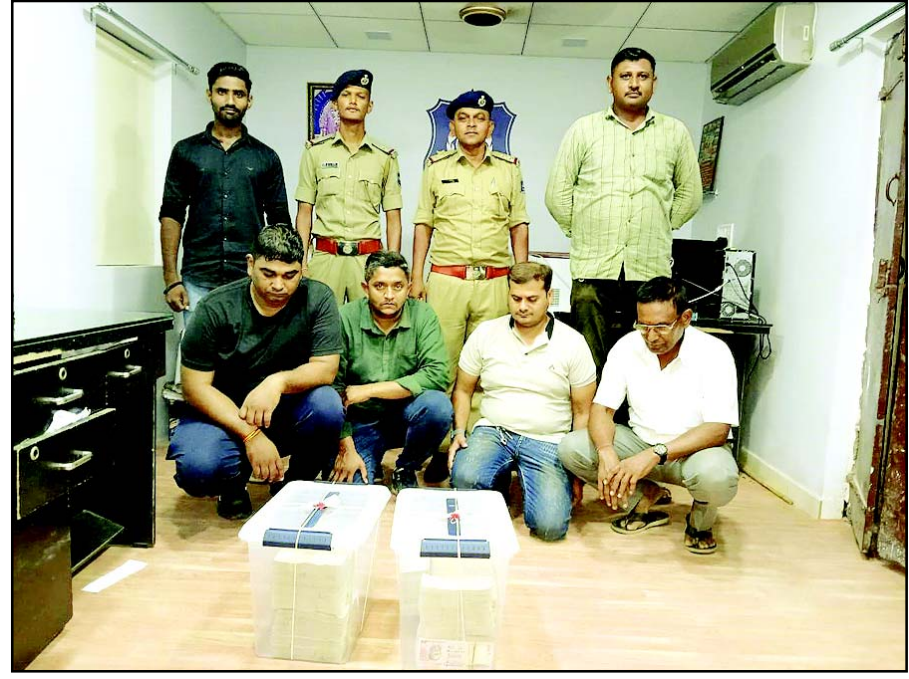
સરકારે ચલણમાંથી રદ કરી દીધેલી રૂપિયા હજાર અને પાંચસોનાં દરની કુલ રૂ. ૭૫ લાખની કિંમતની ચલણી નોટ સાથે ડુમસ પોલીસે ચાર યુવકોની ધરપકડ કરી હતી. ડુમસ પોલીસે બાતમીના આધારે ઝડપી પાડેલા ચાર આરોપીઓ તસ્વીરમાં નજરે પડે છે.

ઝીંકાયો છે અને નવસારીમાં જિલ્લામાં ૧૦૬, જલાલપોરમાં ૮૭, ગણદેવીમાં ૫૮, ચીખલીમાં ૫૨, વાંસદામાં ૨૧, ખેરગામમાં ૭૫ મીમી વરસાદ નોંધાયો છે. જ્યારે ગંગ જિલ્લામાં આલવામાં ૪, સાપુતારામાં ૧૮, વઘઈમાં ૧૮ અને સુબીરમાં ૮ મીમી વરસાદ નોંધાયો છે.