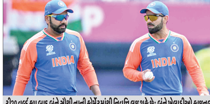
ટી20 વર્લ્ડ કપ બાદ બંને સૌથી નાની ફોર્મેટમાંથી નિવૃત્તિ લઈ શકે છે; બંને ખેલાડીઓ ફાઇનલ દરમિયાન ભારતીય જર્સીમાં પોતાની છેલ્લી ટી20 ઈન્ટરનેશનલ મેચ રમે તેવી સંભાવના; ભારત 2026માં ટી20 વર્લ્ડ કપની ચર્ચામાંથી કરશે ત્યારે રોહિત 39, કોહલી 38 વર્ષના થઈ જશે.

ભારતીય ક્રિકેટનો પ્રત્યેક સમર્થક શનિવારે બાર્બાડોસ ખાતે ટી20 વર્લ્ડ કપની ફાઇનલ બાદ સુકાની રોહિત શર્મા અને વિરાટ કોહલીની આંખો આંસુઓથી ભરાયેલી જોવા માગશે નહીં. આ સ્થિતિ સાત મહિના અને 10 દિવસ પહેલાં વન-ડે વર્લ્ડ કપની ફાઇનલ બાદ જોવા મળી હતી. પ્રત્યેક સમર્થક બંને મહાન ખેલાડીઓની સાથે મી. આધારભૂત તરીકે જાણીતા બનેલા ક્રોચ રાહુલ દ્રવિડને રમતની સૌથી નાની ફોર્મેટમાંથી વિજયી વિદાય આપવા માગશે. બંને ખેલાડીઓ ફાઇનલ દરમિયાન ભારતીય જર્સીમાં પોતાની છેલ્લી ટી20 ઈન્ટરનેશનલ મેચ રમે તેવી પૂરી સંભાવના છે. પસંદગીકારો હવે રોહિત, કોહલી અને જાડેજાને ટી20 ફોર્મેટમાં વધારે તક આપશે નહીં તે નિશ્ચિત છે. આગામી મહિને ડિસેમ્બરે સામેની શ્રેણીથી ભારત 2026ના ટી20 વર્લ્ડ કપને ધ્યાનમાં રાખીને એક નવી શરૂઆત કરવા માગશે. માનવામાં આવી રહ્યું છે