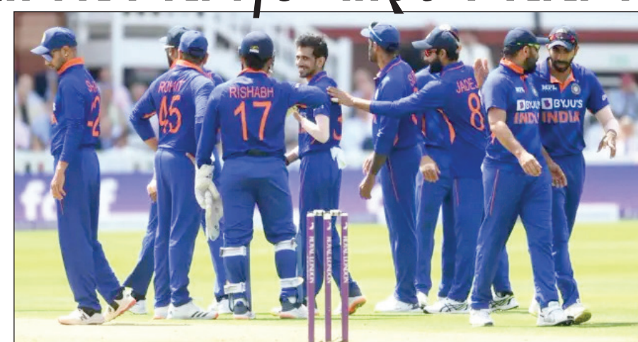
સાઉથ આફ્રિકા પ્રથમ અને ભારતીય ટીમ ત્રીજી વખત ફાઇનલ રમશે; વરસાદના કારણે રમત શક્ય ના બને તો રિઝર્વ-ડેના દિવસે મેચ રમાડવામાં આવશે; જો બંને દિવસ ધોવાઈ જાય તો જોઈન્ટ વિનર બહેર કરાશે

આઈસીસી ટી20 વર્લ્ડ કપની બંને ફાઇનલિસ્ટ ટીમ નક્કી થઈ ચૂકી છે. ભારત અને સાઉથ આફ્રિકા વચ્ચે શનિવારે ફાઇનલ રમાશે. આફ્રિકન પેસ પ્રથમ વખત ફાઇનલમાં રમશે. બીજી તરફ ભારત 10 વર્ષ બાદ ટી20 વર્લ્ડ કપની ફાઇનલ રમશે. બંને ટીમોએ ટૂર્નામેન્ટમાં રમેલી અત્યાર સુધીની તમામ મેચો જીતી છે.