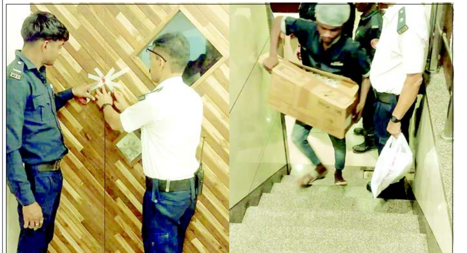
ફાયર સેફ્ટી અંગે સુરત ફાયર બ્રિગેડ દ્વારા સુરત રેલ્વે સ્ટેશન સામે આવેલા ત્રણ ડાઈનિંગ હોલ બેઝમેન્ટમાં હાલતા હોવાથી આગની દુર્ઘટનાનાં આગમચેતીનાં પગલાંરૂપે ગણાયે રથગો પર આજે સીલ મારી દેવાયા હતા. ફાયર બ્રિગેડ દ્વારા બેઝમેન્ટમાં કોમર્શીયલ પ્રવૃત્તિઓ પર રોક લગાવવાનું શરૂ કરી દેવાયું છે.

તથા ધીમી ધારે મેઘરાજા વરસી રહ્યા છે. છેલ્લા ૨૪ કલાકના આંકડા જોતા સાપુતારા ખાતે ૧૮ ઘંટ, આહવા ખાતે ચાર એમ એમ, વઘઈ ખાતે ૧૮ એમ. એમ. અને સુબીર ખાતે ૮ એમ. એમ. વરસાદ નોંધાયો હતો. ગતરોજ સાપુતારા ખાતે ૧૮ એમએમ વરસાદ નોંધાતા મોસમનો ફુલ વરસાદ ૧૨૫ એમ એમ પર પહોંચ્યો હતો. જોકે રાત્રિ અનુસંધાન પાના ૭ પર