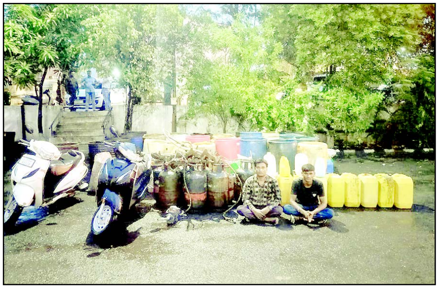
સચીન પોલીસની હદમાં ગભેણીમાં દારૂની ભઠ્ઠીઓ પર સ્ટેટ વિજિલન્સ પોલીસ દ્વારા છાપો મારવામાં આવતાં કાંઠા વિસ્તારનાં બુટલેગરોમાં ફફડાટ વ્યાપી ગયો છે. સ્ટેટ પોલીસે દારૂ ગાળનાર બે આરોપીઓની મુદ્દામાલ સાથે ધરપકડ કરી હતી.